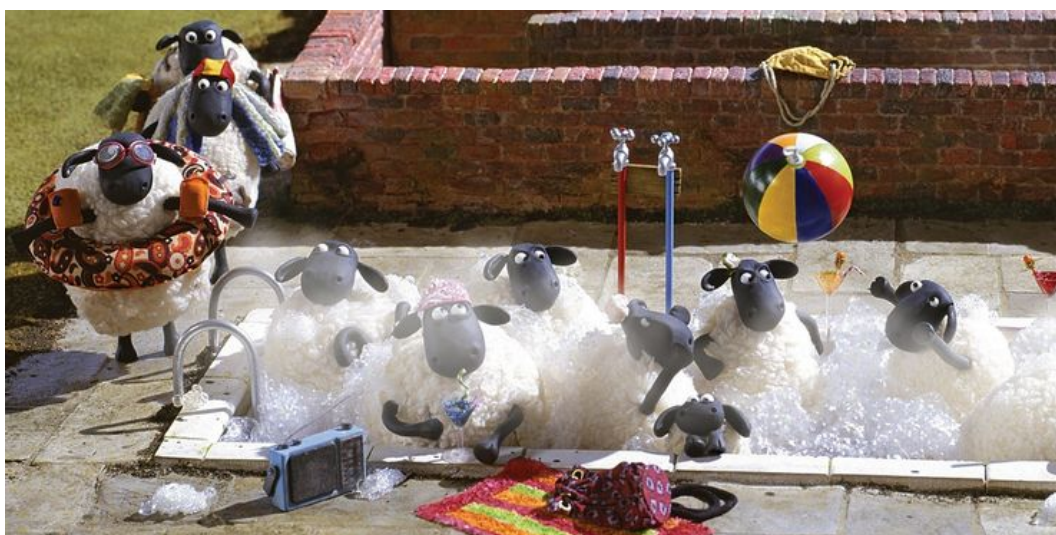
Figure 1: https://www.cbr.com/shaun-the-sheep-best-worst-episodes-imdb/